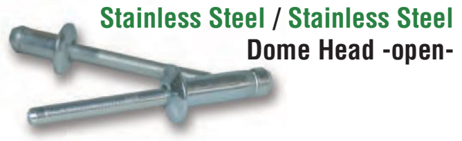
Stainless Steel / Stainless Steel Dome Head - open-